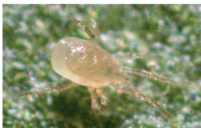
Fig. 2. Adulto de Phytoseiulus persimilis .