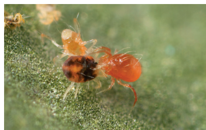
Fig. 3. Adulto de Phytoseiulus persimilis depredando a Tetranychus urticae . Cambio de coloración.